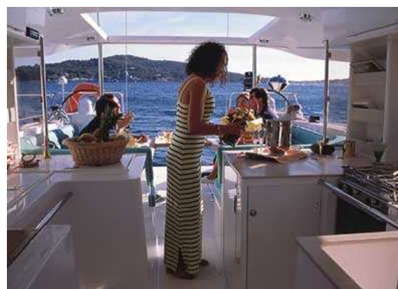
Die Atoll 6